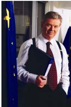
David Byrne EU Kommissar für Gesundheits- und Verbraucherschutz