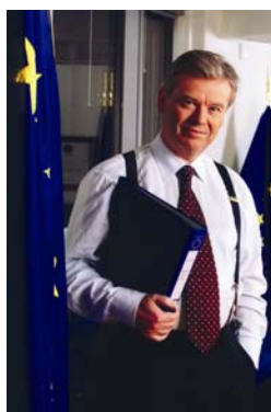
David Byrne Commissario Europeo per la Salute e la Protezione dei Consumatori